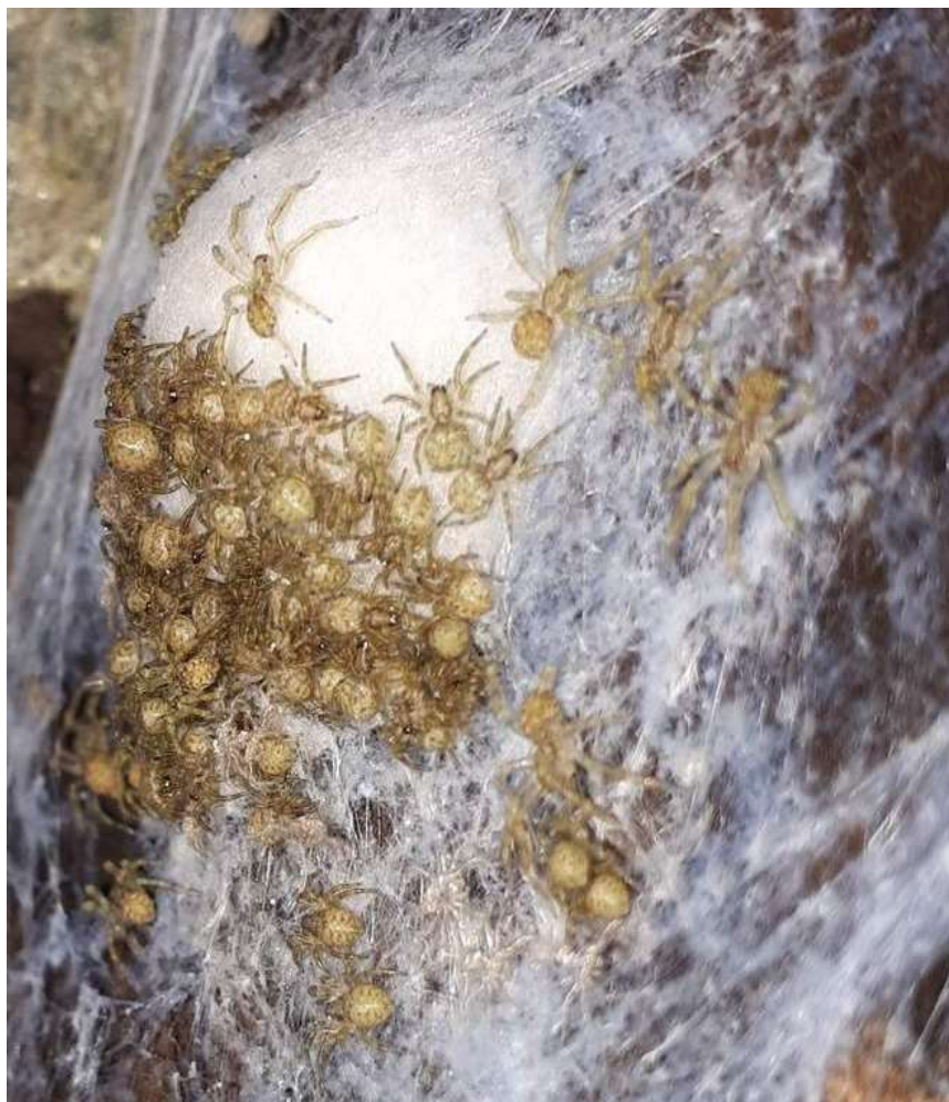
Obr. 2: Mládka Z. spinimana čerstvě vylezlá z kokonu