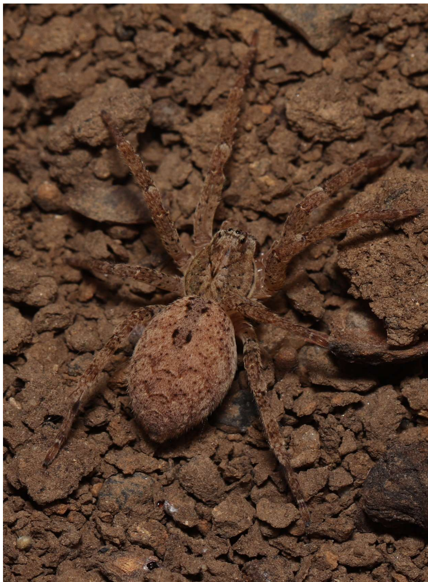
Obr. 3: Mládě Z. spinimana z odchovu (foto K. Rückl)