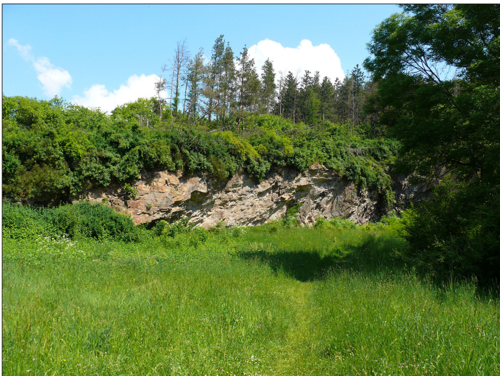
Ryc. 5. Fragment łąki w rezerwacie Skalki Stoleckie, na której obserwowano samca i samicę Synema globosum.