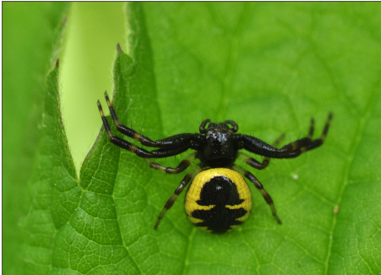
Ryc. 2. Samica Synema globosum zaobserwowana w Krępie.

Fig. 1. Female of Synema globosum observed on the meadow in Nisko.