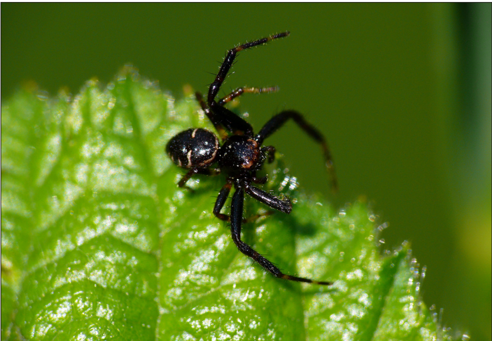
Ryc. 4. Samiec Synema globosum zaobserwowany na łące w rezerwacie Skalki Stoleckie. Fig. 4. Male of Synema globosum observed on the meadow in Skalki Stoleckie reserve.