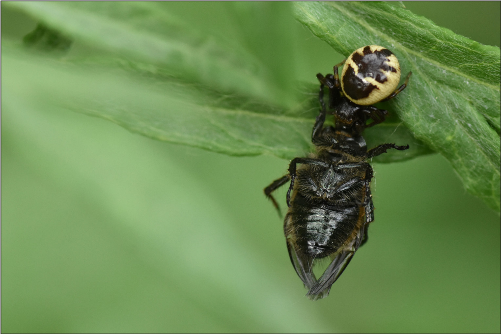
Ryc. 3. Samica Synema globosum z ofiarą zaobserwowana w Wyszynie. Fig. 3. Female of Synema globosum with prey observed in Wyszyna.