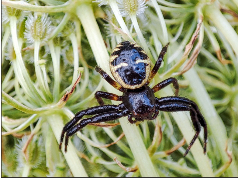
Ryc. 1. Samica Synema globosum zaobserwowana na łące w Nisku.

Fig. 1. Female of Synema globosum observed on the meadow in Nisko.